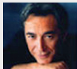
Avec Richard Berry , parrain d'AIRG France